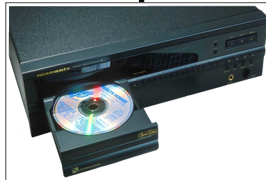
Le lecteur de CD de Philips et Sony