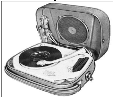
L'électrophone de Teppaz