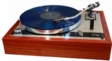
La platine disque Thorens