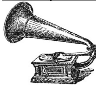
Le Gramophone de Emile Berliner