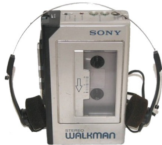
Le walkman de Sony