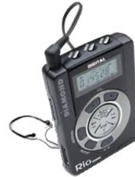
Le RIO PMP300 de Diamond Multimedia