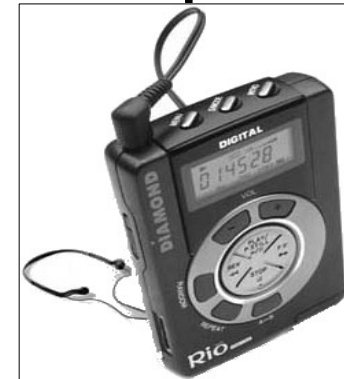
Le baladeur numérique Rio PMP300 de Diamond Multimedia