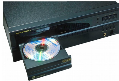
Le lecteur CD de Philips et Sony