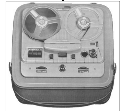
Le magnétophone d'AEG et Telefunken